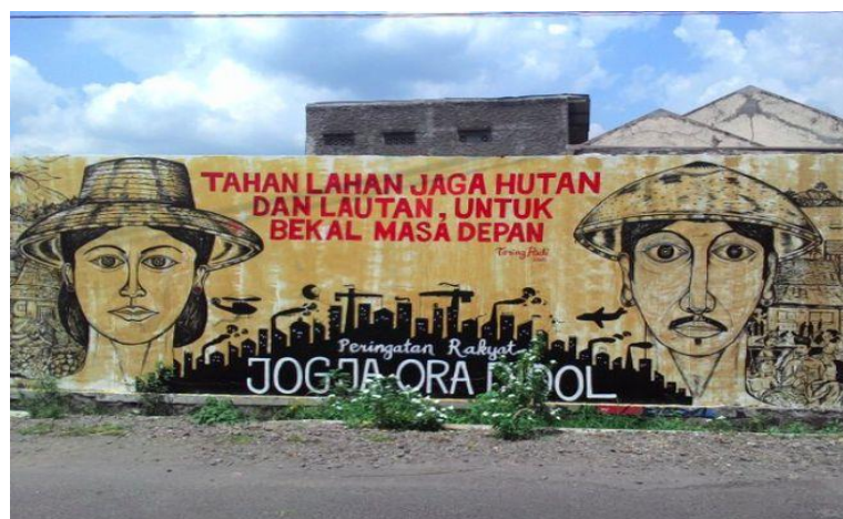
Gambar 3.5 Mural Karya Taring Padi Utuh

Berikut ini adalah gambar karya dari Taring Padi