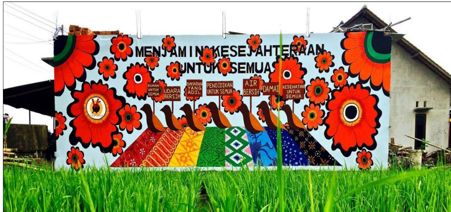
Gambar 3.3 Mural Karya Megan Wilson Utuh

Berikut ini adalah gambar karya dari Megan Wilson