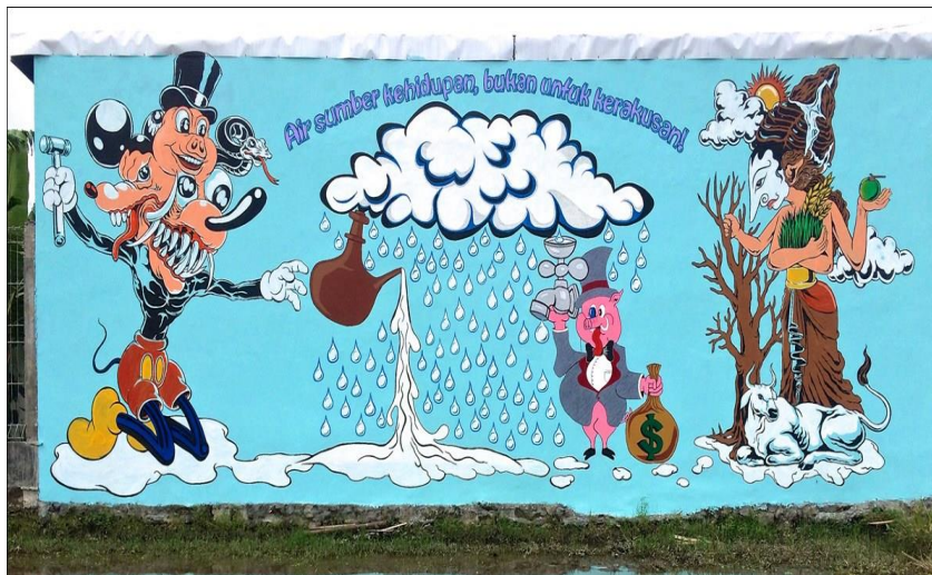
Gambar 3.1 Mural Karya Nano Warsono dan Christopher Statton

Berikut ini adalah gambar karya dari Nano Warsono dan Christopher Statton: