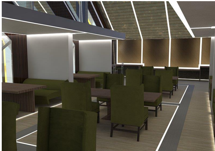
Gambar 5. 1 Ruang Member

Gambar 5. 1 menunjukkan pada interior ruang member yang memperlihatkan pembagian antar ruang untuk privasi pengguna. Privasi itu sendiri terbagi atas beberapa tingkah laku dan diantaranya adalah keinginan untuk lebih intim dengan keluarga dan teman akan tetapi jauh dari orang lainnya.