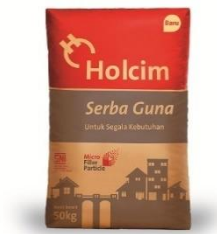
Gambar 4.1 Semen Portland

Semen yang digunakan dalam penelitian ini adalah semen dengan merek Holcim. Kemasan semen haruslah dalam keadaan baik atau tidak rusak. Serta fisik semen harus baik. Dalam artian semen dalam keadaan tidak menggumpal. Semen Portland yang digunakan dapat dilihat pada Gambar 4.1.