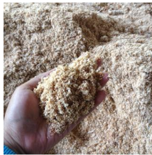
Gambar 4.6 Serbuk Gergaji Kayu

Pada penelitian ini serbuk gergaji kayu digunakan sebagai substitusi sebagian semen. Serbuk gergaji kayu didapat dari Pasar Kayu Muntilan, yang dapat dilihat pada Gambar 4.6.