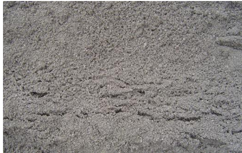
Gambar 4.3 Agregat Halus