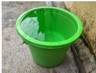
Gambar 4.4 Air

Air yang digunakan dalam pembuatan sampel benda uji berasal dari Laboratorium bahan Konstruksi Teknik, Fakultas Teknik Sipil dan Perencanaan Universitas Islam Indonesia. Air mengemban tugas sebagai katalis untuk beton yang mereaksikan semen menjadi bahan pengikat agregat. Dan juga digunakan sebagai perawatan beton setelah pengecoran agar tidak terjadi keretakan. Air yang digunakan berasal dari Laboratorium Teknologi Bahan Konstruksi, Fakultas Teknik Sipil dan Perencanaan Universitas Islam Indonesia yang dapat dilihat pada Gambar 4.4.