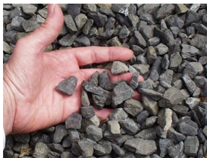
Gambar 4.2 Agregat Kasar

Agregat dikelompokkan menjadi dua, yaitu agregat kasar dan agregat halus. Agregat kasar adalah agregat berupa batu pecah dengan ukuran maksimum 20 mm, sedangkan agregat halus adalah berupa pasir yang lolos saaringan 4,8 mm. Agregat yang digunakan berasal dari Gunung Merapi. Agregat kasar dan agregat halus yang digunakan dapat dilihat pada Gambar 4.2 dan Gambar 4.3.