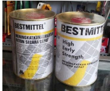
Gambar 4.5 Bestmittel