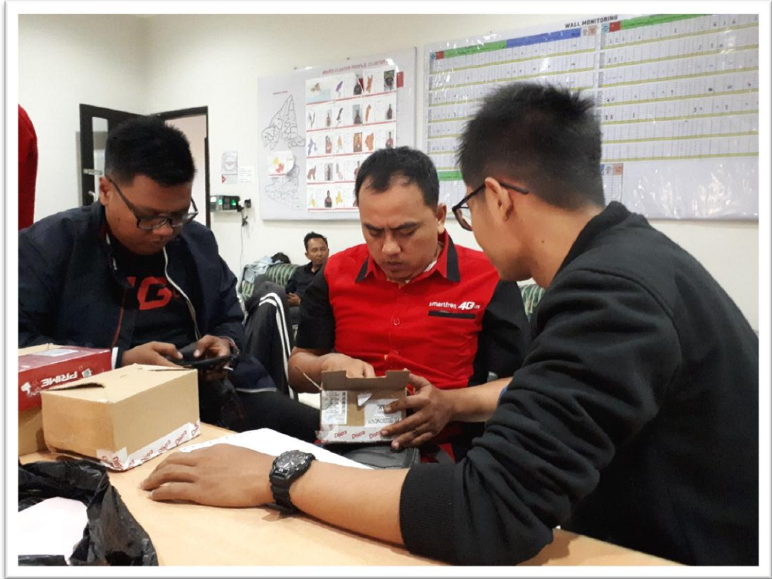
Lampiran 8: Aktivitas setiap pagi