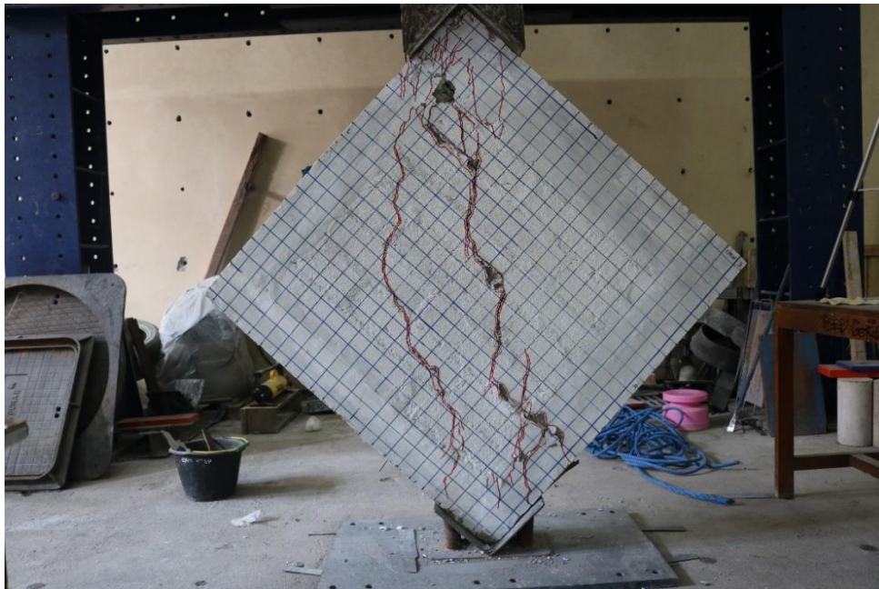
Gambar L-5.2 Benda Uji Confined Masonry Wall 3 Setelah Diuji