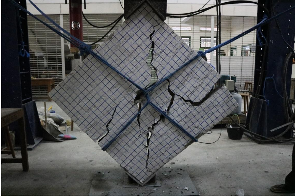
Gambar L-5.3 Benda Uji Dinding Tanpa Perkuatan 3 Setelah Diuji