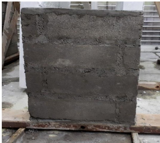
Gambar L-3.14 Benda Uji Dinding Modulus Elastisitas