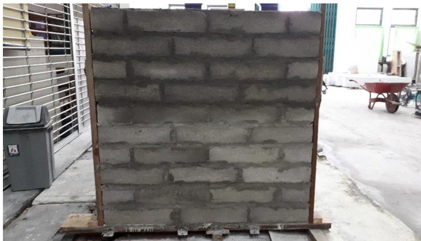
Gambar L-3.12 Benda Uji Dinding Tanpa Perkuatan