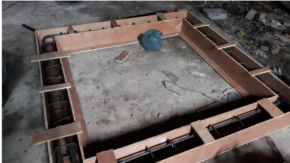
Gambar L-3.1 Proses Pembuatan Bekisting Dinding dengan Perkuatan