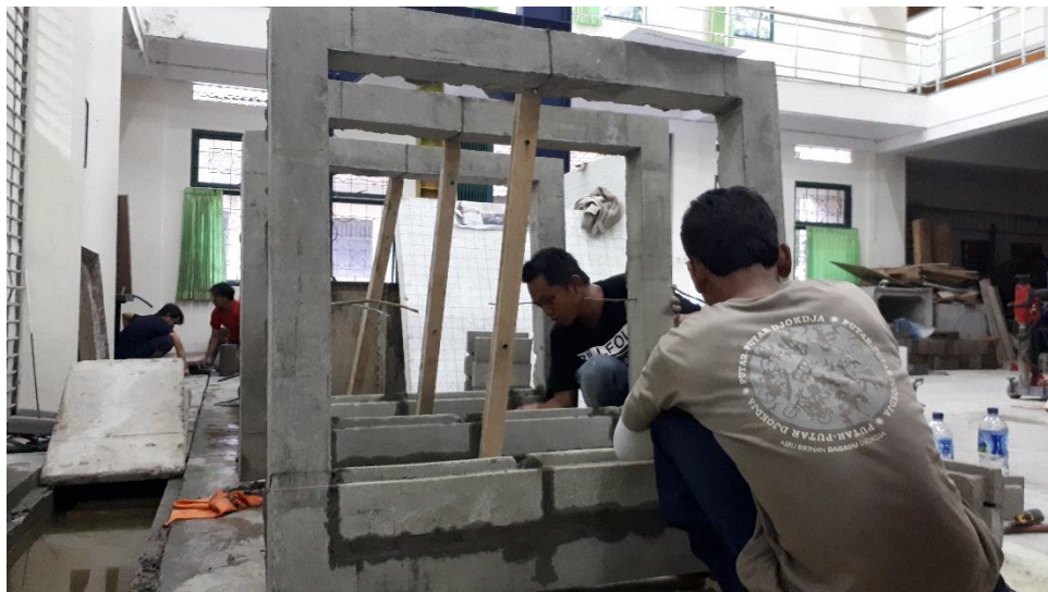
Gambar L-3.2 Proses Pembuatan Reinforced Concrete Infill Masonry Wall