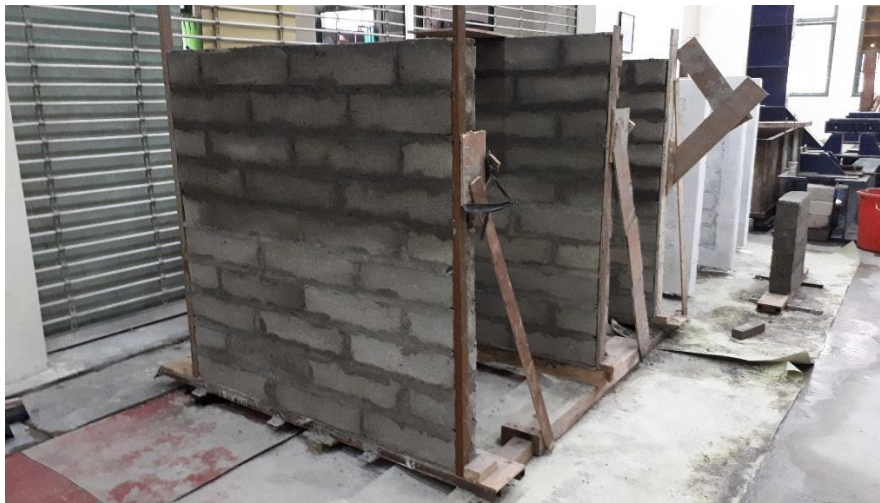
Gambar L-3.13 Benda Uji Dinding Tanpa Perkuatan