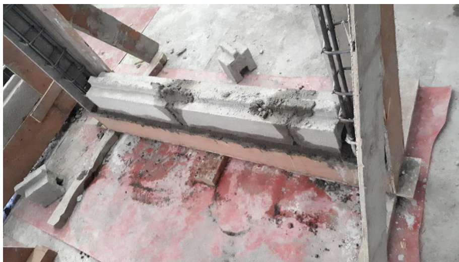
Gambar L-3.8 Proses Pembuatan Confined Masonry Wall