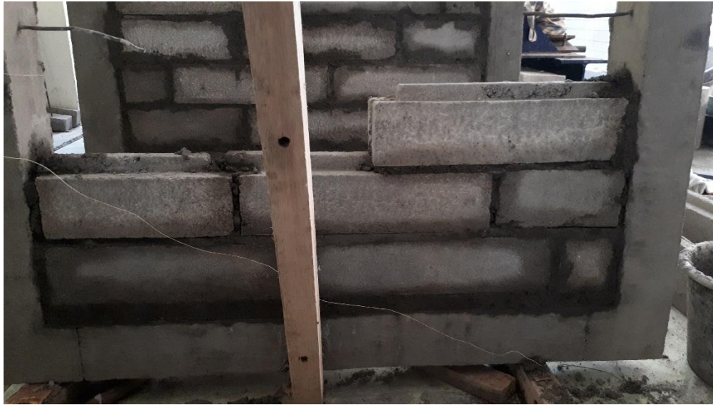
Gambar L-3.5 Proses Pembuatan Reinforced Concrete Infill Masonry Wall