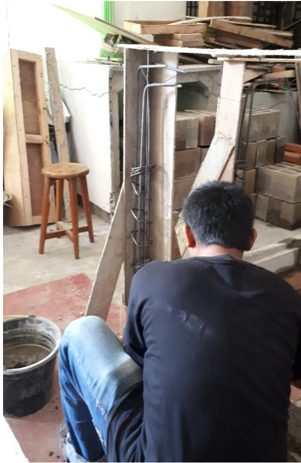
Gambar L-3.7 Proses Pembuatan Confined Masonry Wall