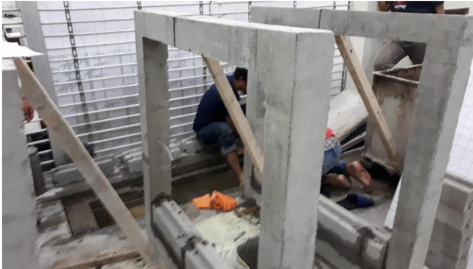
Gambar L-3.3 Proses Pembuatan Reinforced Concrete Infill Masonry Wall