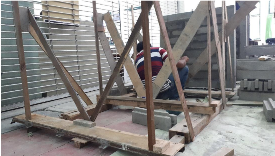
Gambar L-3.11 Proses Pembuatan Bekisting Dinding Tanpa Perkuatan