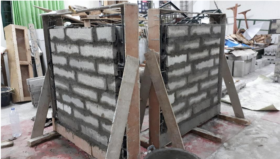
Gambar L-3.9 Proses Pembuatan Confined Masonry Wall