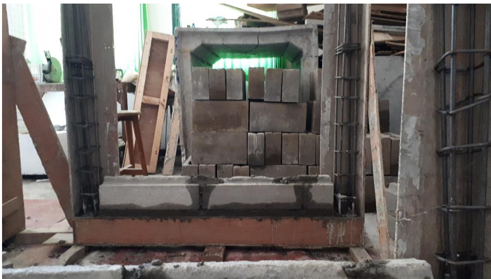
Gambar L-3.6 Proses Pembuatan Confined Masonry Wall