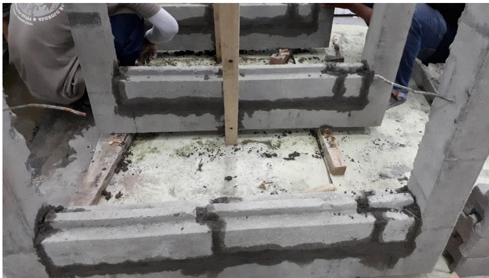
Gambar L-3.4 Proses Pembuatan Reinforced Concrete Infill Masonry Wall