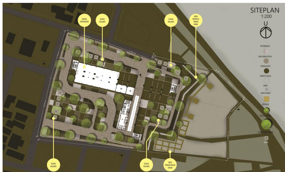
Gambar 5.3 Letak Ruang pertemuan di Lantai Dasar

Ruang Serbaguna diletakkan pada Lantai 1 namun menurut Pembimbing dan Penguji ruangan tersebut ukurannya kecil dan terkesan privat karena diletakkan di lantai 1. Oleh karena itu ditambahkan Ruang pertemuan dengan luas 552 m 2 yang diletakkan di Lantai Dasar. Peletakkan di lantai dasar juga mempertimbangkan agar ruang tersebut memiliki nilai ekonomi seperti dapat disewakan untuk warga luar rusunawa.