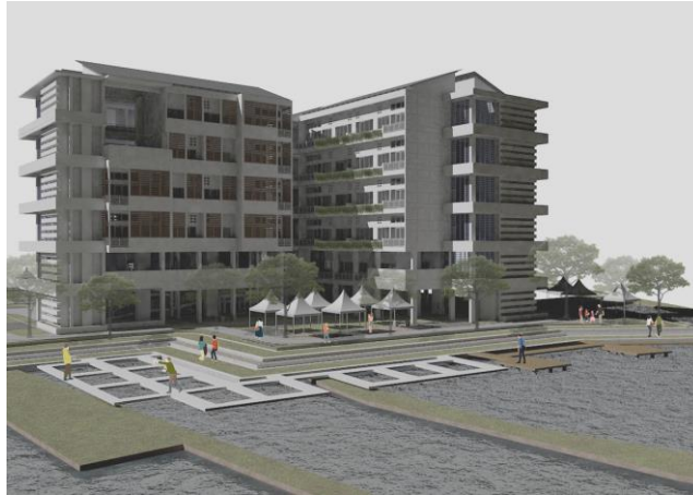
Gambar 5.2 Aktivitas rekreasi di pinggir rawa pemancingan umum dan pusat kuliner