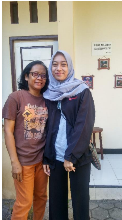
Foto bersama pengurus Bank Sampah Berkah