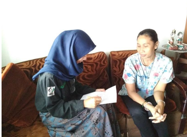
Foto saat melakukan interview