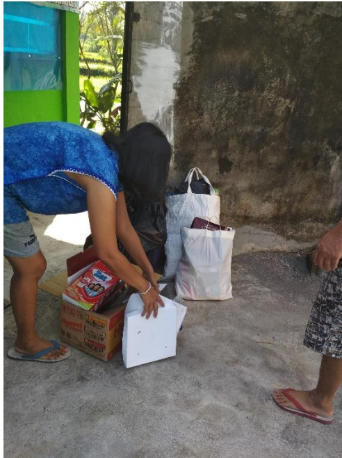
Dilakukan proses pemilahan