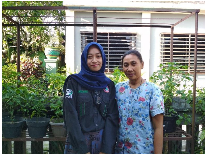
Foto bersama pengurus Bank Sampah Kempling