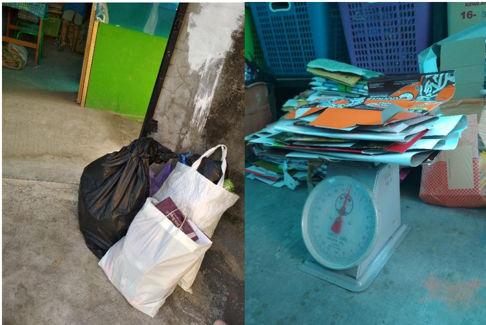
Pengumpulan sampah dari nasabah