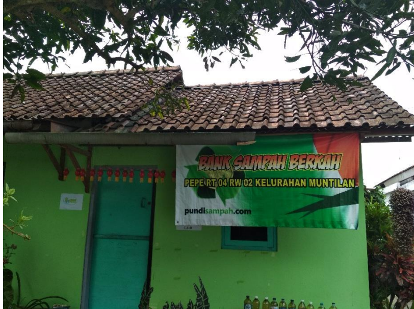
Foto bangunan Bank Sampah Berkah