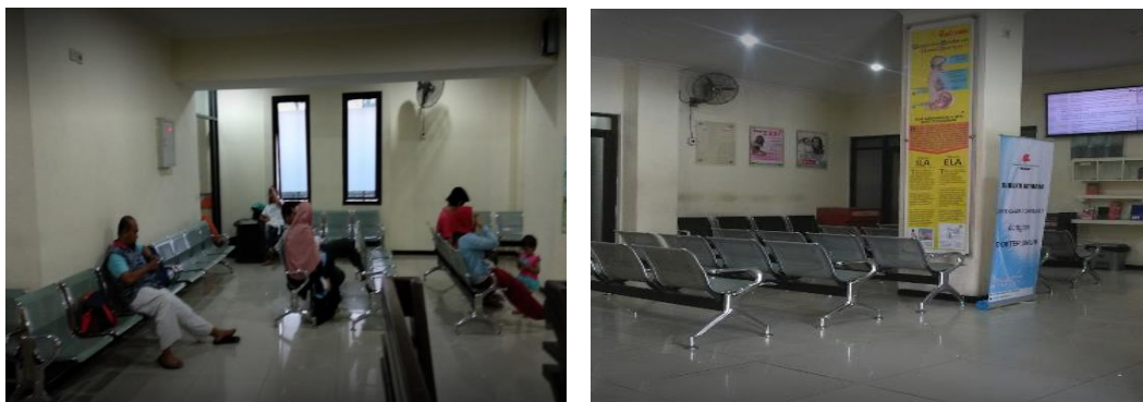
Ruang Tunggu RSKIA Rahmi