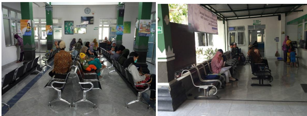
Ruang Tunggu Puskesmas Banguntapan 1