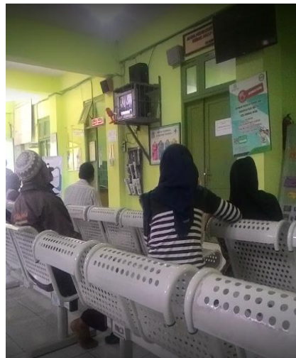
Ruang Tunggu Puskesmas Ngaglik 2