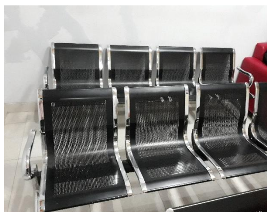
Ruang Tunggu Klinik Indira dr. Phyo Sp. OG