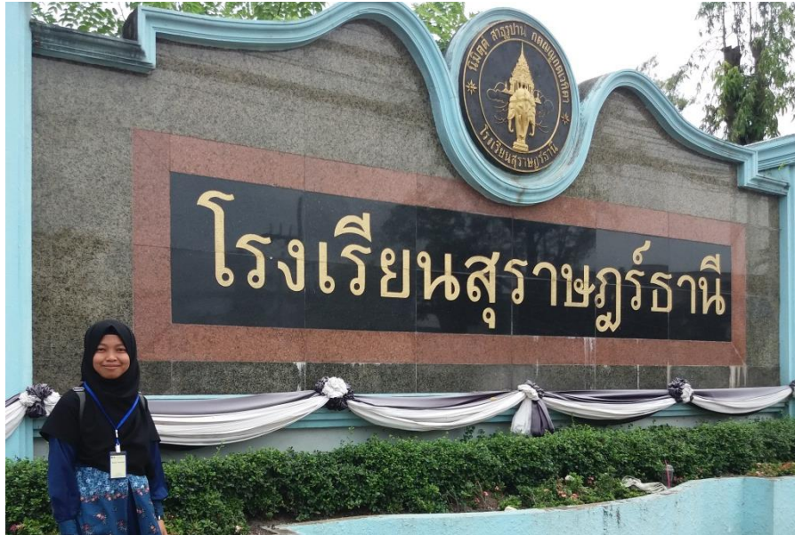
Figure 4.7 The school name sign of Suratthani School