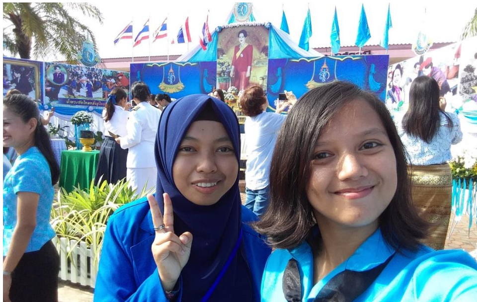
Figure 4.12 Taking part in mother's day celebration with a Philippine friend