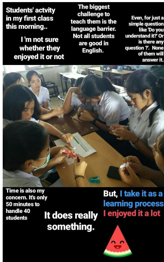
Figure 4.10 An Instagram story posting about teaching experiences