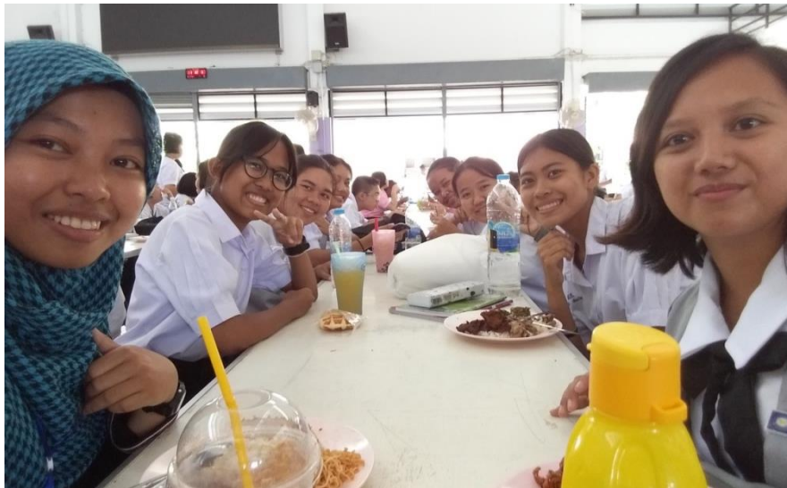
Figure 4.5 Having lunch with students