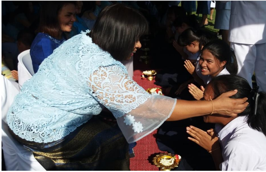
Figure 4.11 Mother's Day celebration traditions