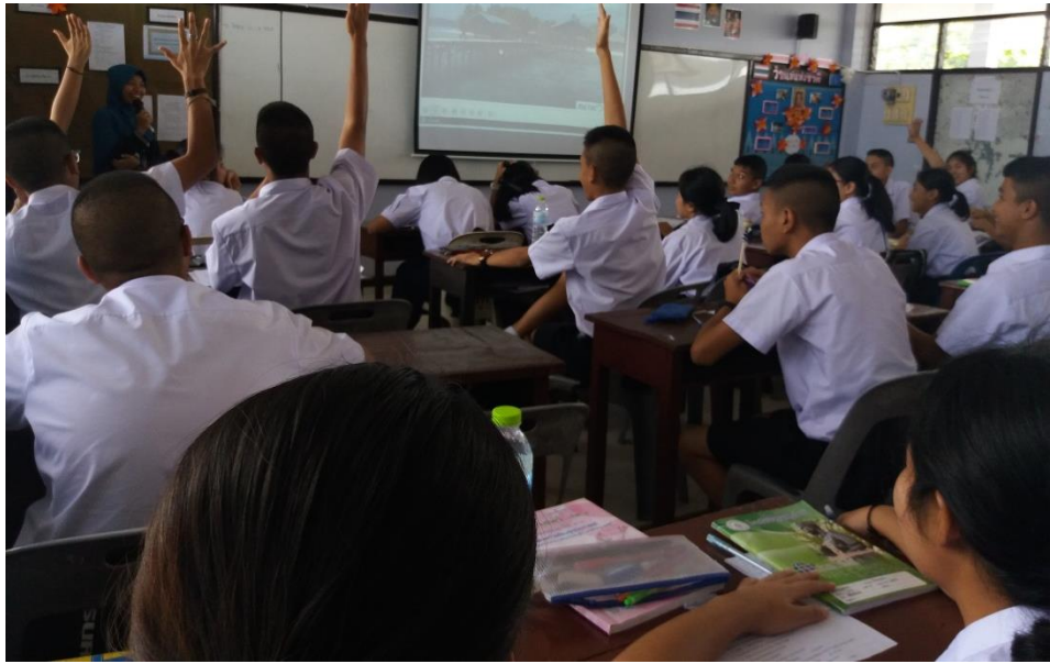
Figure 4.1 Teaching EFL situation