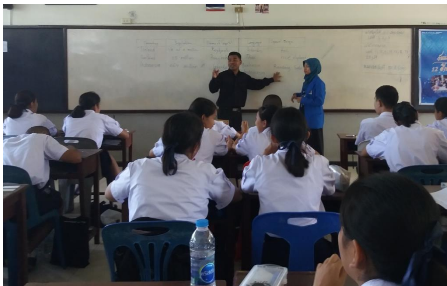
Figure 4.4 Sharing information about Indonesia to the students