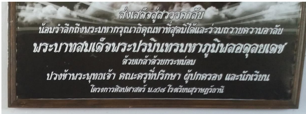
Figure 4.8 A board in the classroom