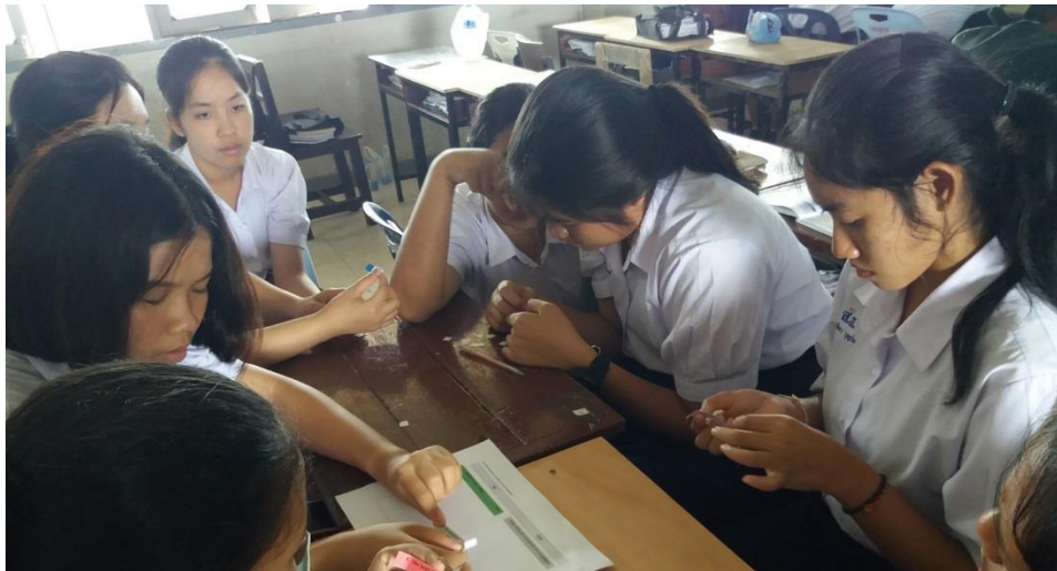
Figure 4.2 Student's activity during the learning process