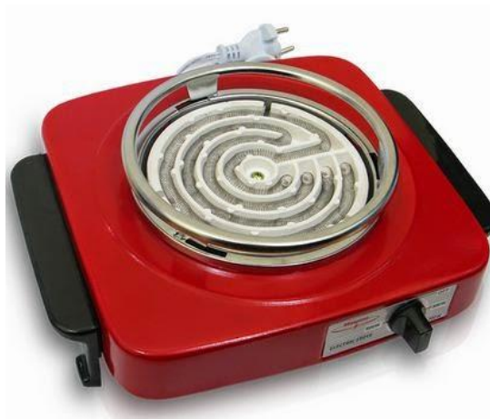
Gambar 3.2. Kompor Listrik merk Maspion dengan daya 600 Watt.