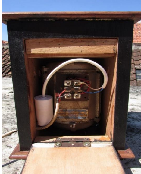
Gambar 3.1. Kompor Induksi.

Pada kompor induksi tersebut menggunakan motor berdaya \frac{1}{2} HP atau memiliki daya sekitar 373 Watt. Kemudian motor yang digunakan pada kompor induksi tersebut memiliki keluaran 0,37 KW dan memiliki frekuensi sebesar 50 Hz. Motor yang digunakan berjenis YY7124 serta tegangan yang dihasilkan dari motor tersebut sebesar 220/380 Volt.