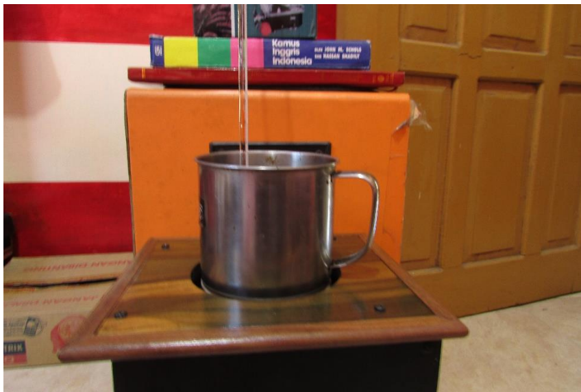
Gambar 3.4. Pengujian menggunakan termometer.

Pengukuran waktu dilakukan dengan menggunakan stop-watch dan sedangkan pengukuran suhu dilakukan dengan menggunakan termometer. Pada saat mengukur waktu dengan menggunakan stop-watch dimulai dari 0 hingga nilai suhu mencapai 50°C dan 80°C untuk menunjukkan detik kesekian dan sedangkan pada saat pengukuran suhu tersebut dilakukan sebanyak 10 kali dengan cara meletakkan termometer pada gelas stainless steel yang sudah diberi air sebanyak 350 cc agar mendapatkan nilai panas yang diperoleh dari masing-masing kompor tersebut. Untuk mendapatkan waktu yang diperoleh maka harus menunggu air hingga mencapai pada suhu 50°C dan sampai suhu mencapai 80°C pada masing-masing kompor tersebut. Pengujian tersebut dilakukan seperti pada Gambar 3.4. berikut.