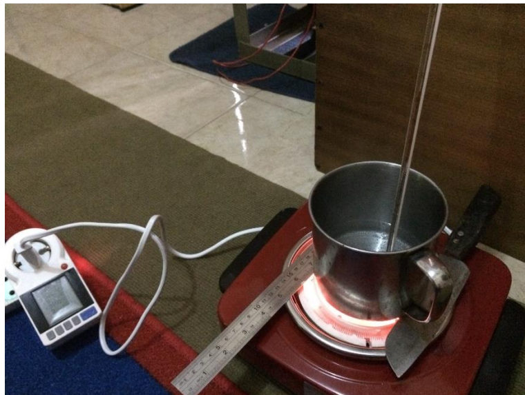
Gambar 3.5. Pengujian menggunakan energy meter.

Pengujian kompor induksi maupun kompor listrik 600 Watt dilakukan untuk mengetahui berapa besar nilai arus, tegangan, cos \phi dan daya dengan menggunakan alat yaitu energy meter, alat tersebut digunakan untuk memperoleh nilai atau berapa besar angka yang dihasilkan dari masing-masing kompor baik itu kompor induksi atau kompor listrik 600 Watt. Pada kontak kompor induksi maupun kompor listrik 600 Watt ditancapkan pada energy meter kemudian pada energy meter tersebut ditancapkan pada terminal agar nilai yang keluar muncul atau dapat terbaca. Setelah sudah dipasang semua maka diuji kompor induksi dengan menggunakan air sebanyak 350 cc kemudian dilakukan sebanyak 10 kali percobaan pada saat suhu mencapai 50 °C dan pada suhu 80 °C ketika sudah selesai menguji maka diganti untuk menguji dengan menggunakan kompor listrik 600 Watt dengan cara yang sama seperti pada kompor induksi. Pengujian tersebut dilakukan seperti pada Gambar 3.5. berikut.