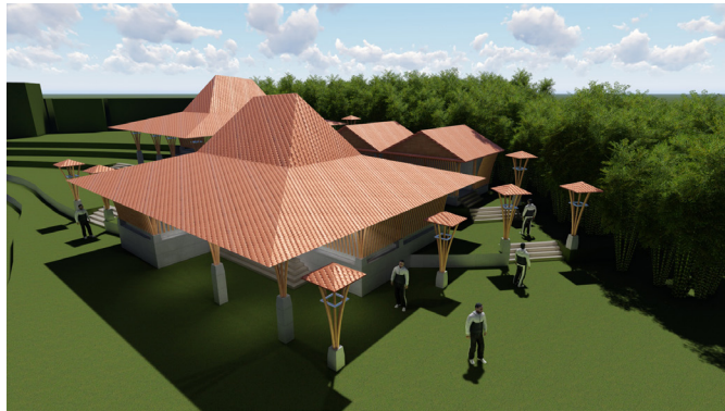
Desain setelah evaluasi