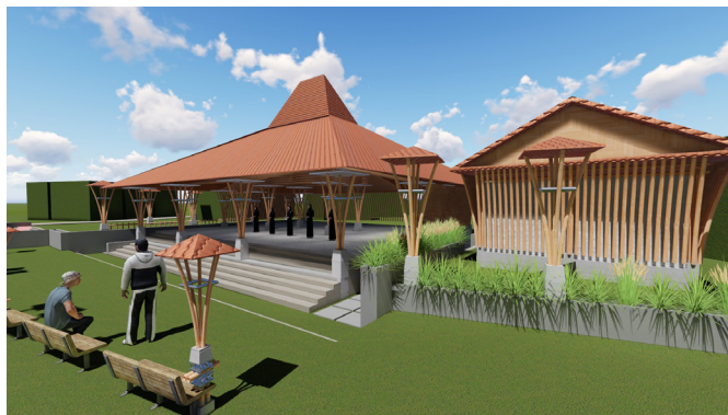
Desain setelah evaluasi