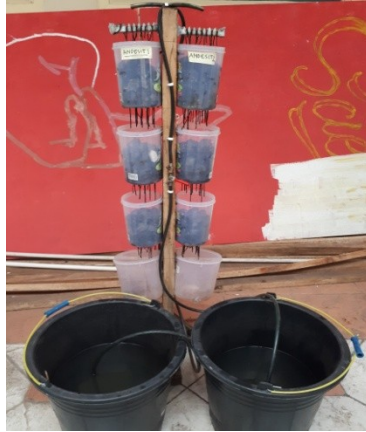
Unit Tray Bioreactor