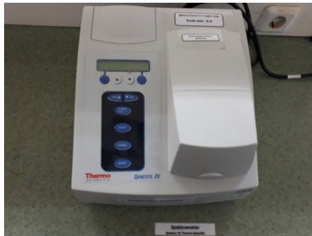
Spektrofotometer yang digunakan