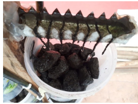
Wadah pendistribusian air