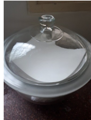
Desikator yang digunakan untuk meletakkan kertas saring (TSS)