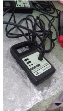
Alat DO Meter yang digunakan