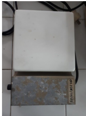
Stirer yang dipergunakan untuk pengujian TSS