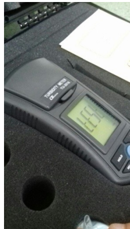
Alat turbidimeter yang digunakan