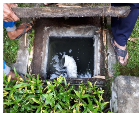
Tempat pengambilan air limbah efflurnt IPAL Mendiro