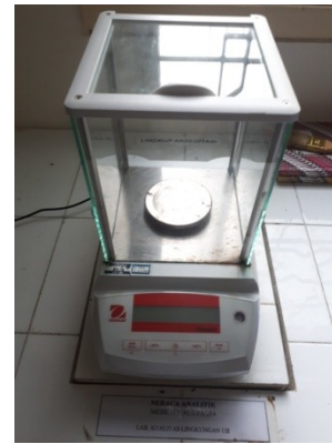
Neraca Analitik untuk menimbang kertas saring