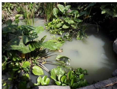
Effluent IPAL Komunal Mendiro