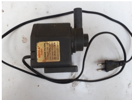
Pompa Air P1800