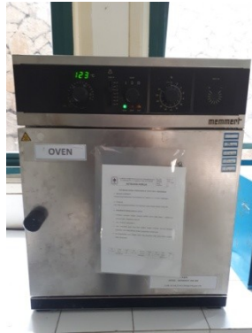
Oven yang digunakan untuk Mengoven kertas saring (TSS)