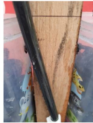
Selang air yang kotor