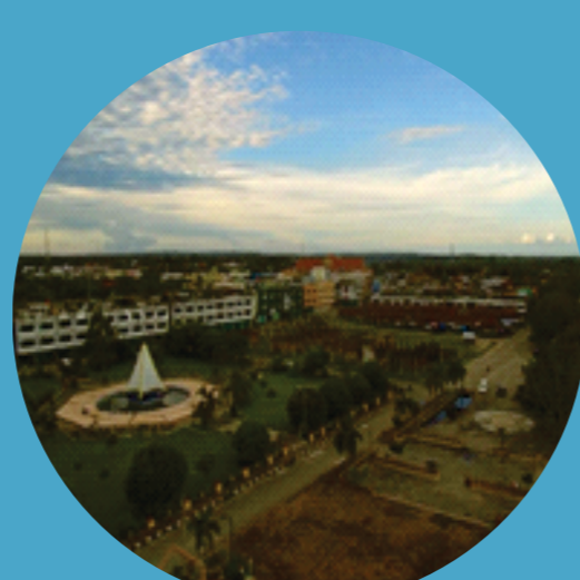
Potensi rekreasi sungai Kuantan yang belum maksimal