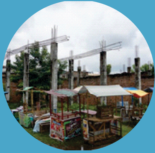
Permasalahan Pedagang informal Pacu Jalur