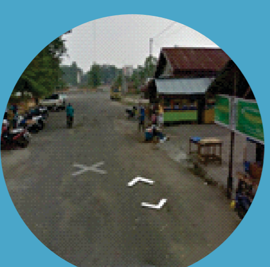
Lingkungan Kota yang tidak ramah Pejalan Kaki