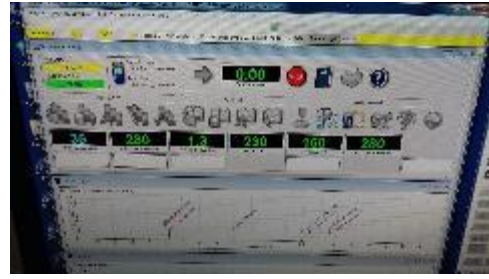
Tampilan Layar komputer GCMS