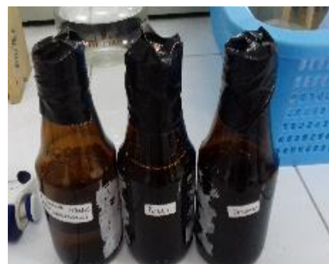
Sampel dalam Botol