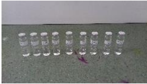
Sampel siap dibaca