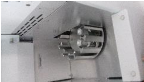
Memasukan sampel ke GCMS