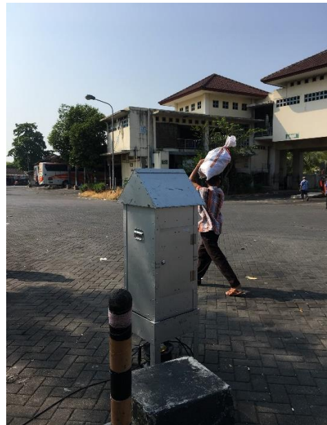
Gambar 4. High Volume Air Sampler