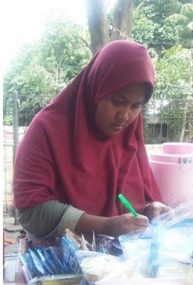
Gambar 5. Proses Pengisian Data Diri Responden Penjaga Warung Makan Menggunakan Kuesioner