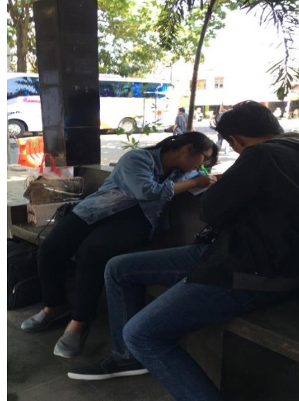
Gambar 6. Proses Pengisian Data Diri Responden Penumpang Bus Menggunakan Kuesioner