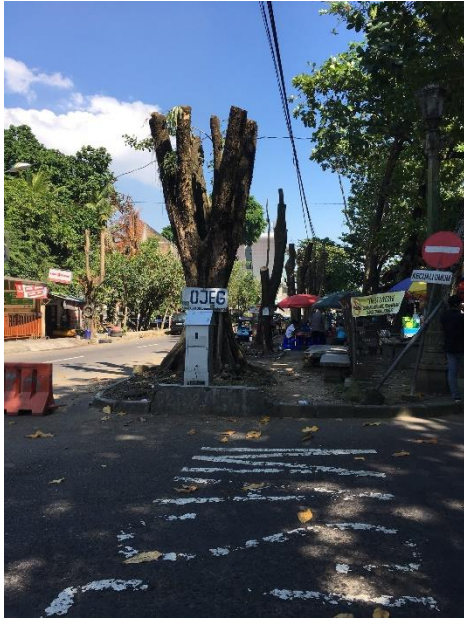
Gambar 1. Kondisi Lingkungan dan Cuaca di Terminal Jombor