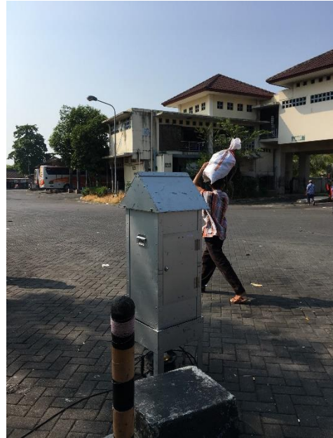
Gambar2. Kondisi Lingkungan dan Cuaca di Terminal Giwangan