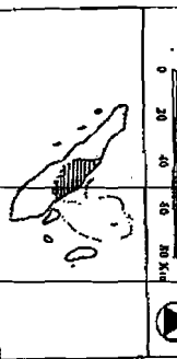
PETA JARINGAN JALAN