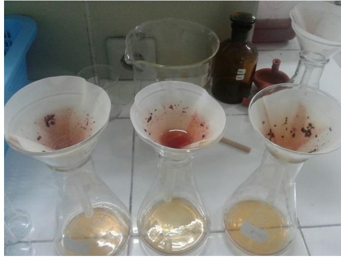
Gambar 3 Pengujian Total Suspended Solid (TSS)