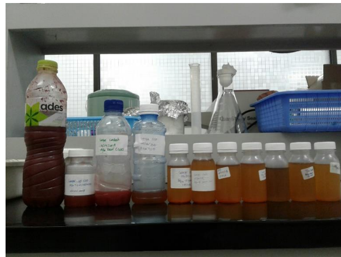
Gambar 2 Hasil Pengujian pada Tahap Aklimatisasi