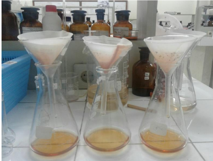
Gambar 6 Pengujian Warna (PtCo)