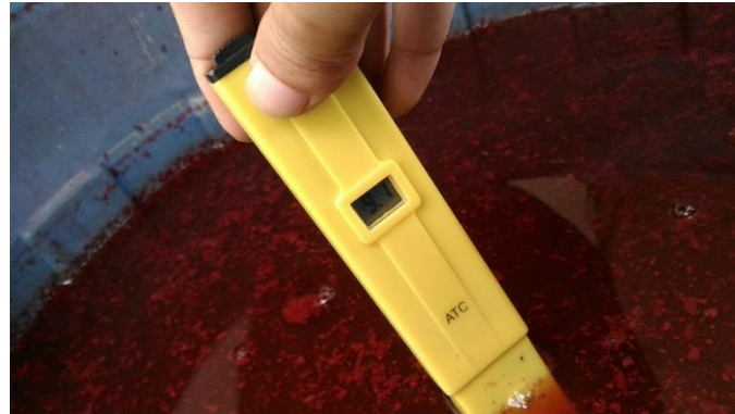
Gambar 1 Pengujian pH pada Air Limbah Batik