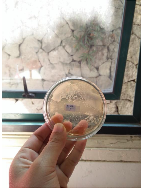
Gambar 8 Pengujian Mikrobiologi pada Air Limbah Batik