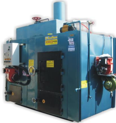
Gambar 2.4 Insinerator Rumah Sakit