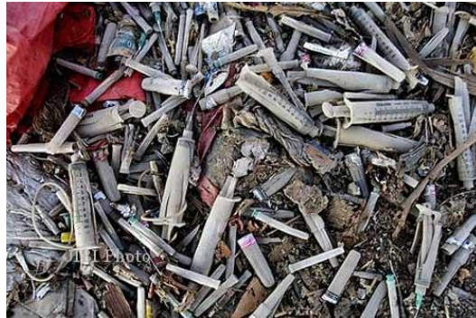
Gambar 2.1 Limbah Medis Rumah Sakit