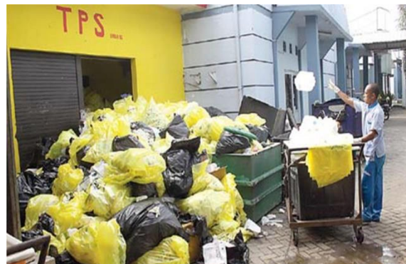
Gambar 2.2 Limbah non Medis

Sampah padat non medis adalah semua sampah padat diluar sampah padat medis yang dihasilkan dari berbagai kegiatan seperti di kantor/administrasi, unit perlengkapan, ruang tunggu, ruang inap, unit gizi/dapur, halaman parkir, taman, dan unit pelayanan.