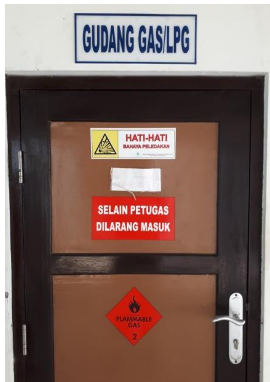
Gambar 9. Poster peringatan pencegahan risiko bahaya peledakan