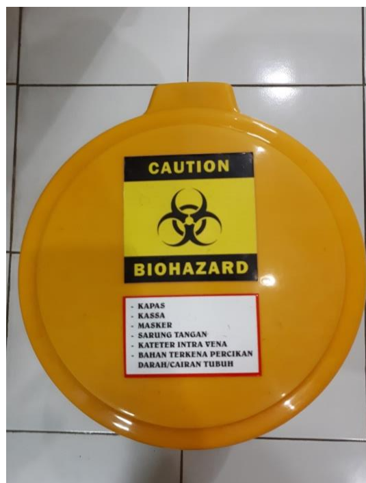
Gambar 10. Label mengenai jenis limbah yang dapat dibuang dalam tempat berwarna kuning