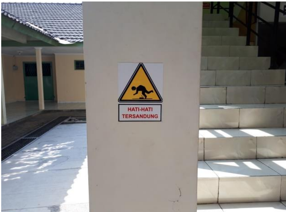
Gambar 6. Poster peringatan pencegahan risiko