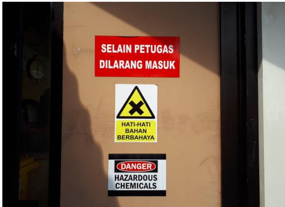
Gambar 4. Poster Pengendalian risiko bahan berbahaya