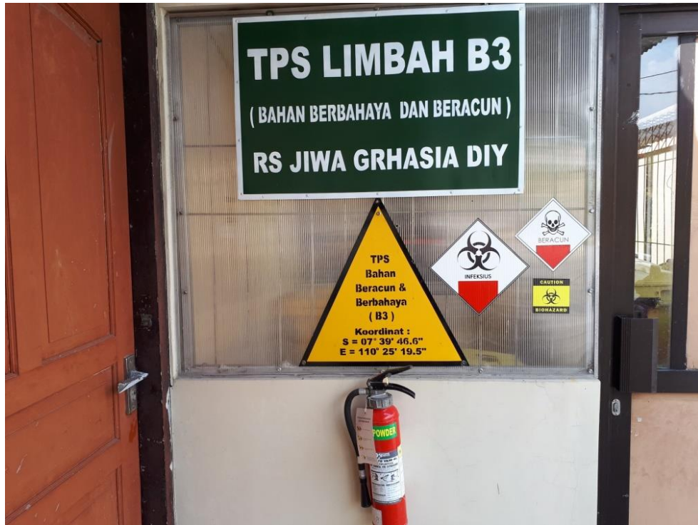
Gambar 3. Poster Pengendalian risiko pemberitahuan bahan infeksius dan beracun