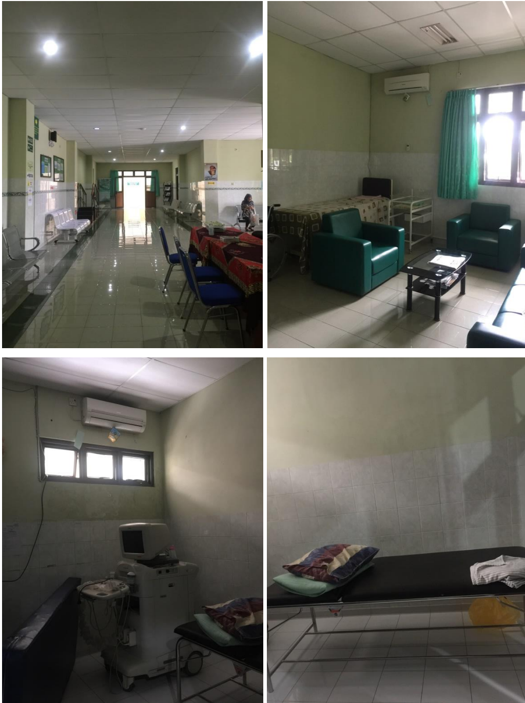
Gambar 13. Beberapa Fasilitas RSJ Grhasia D.I.Yogyakarta