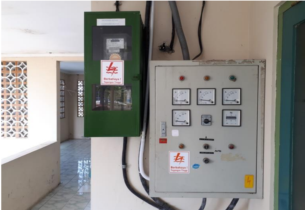
Gambar 5. Poster Pengendalian risiko pada panel listrik dengan tanda berbahaya