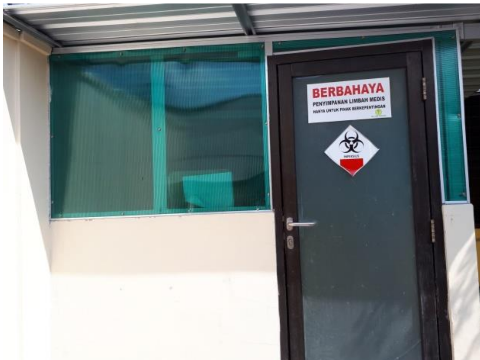
Gambar 2. Poster Pengendalian risiko BERBAHAYA bagi penyimpanan limbah B3