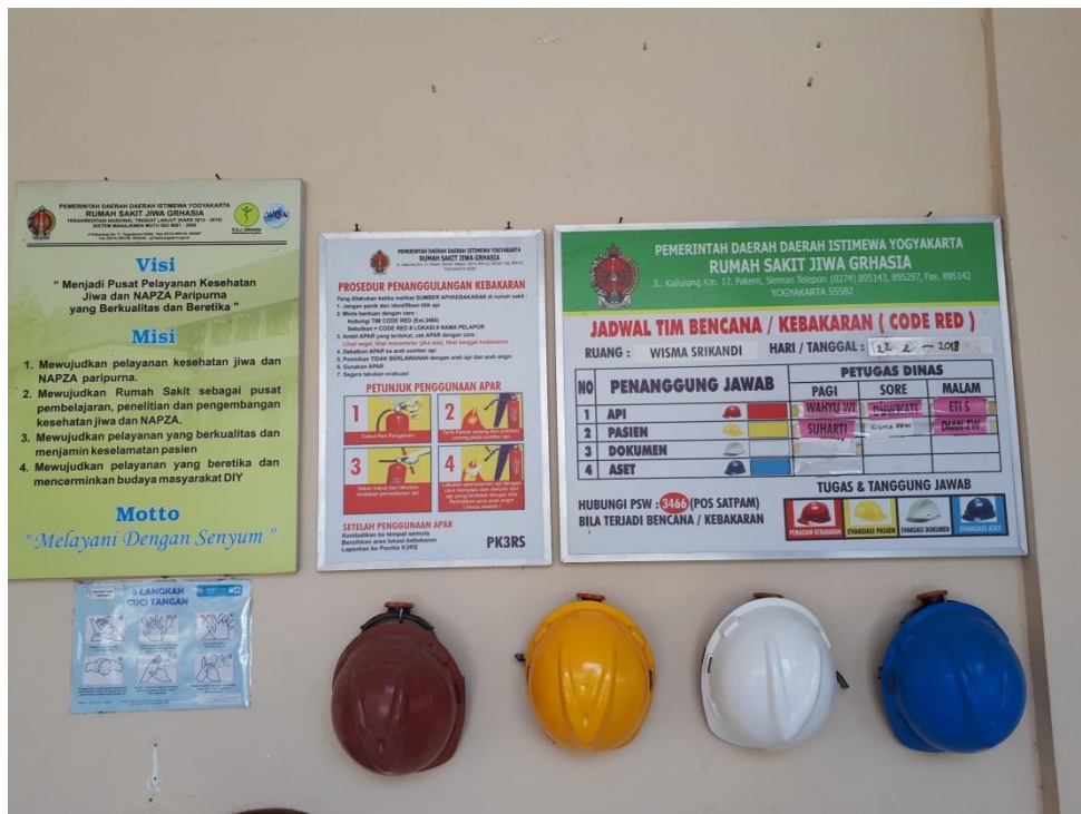
Gambar 1. Poster Penggunaan APAR dan Jadwal Penanggung Jawab Kebakaran