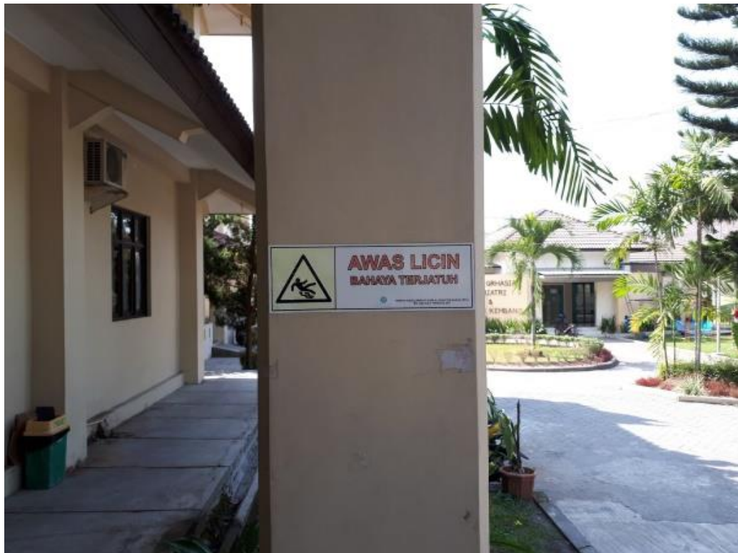
Gambar 8. Poster peringatan pencegahan risiko