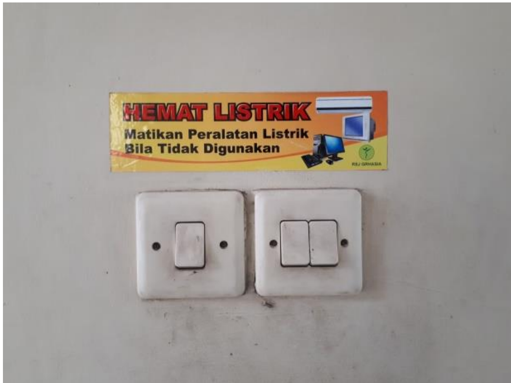
Gambar 7. Poster peringatan pencegahan risiko bahaya listrik