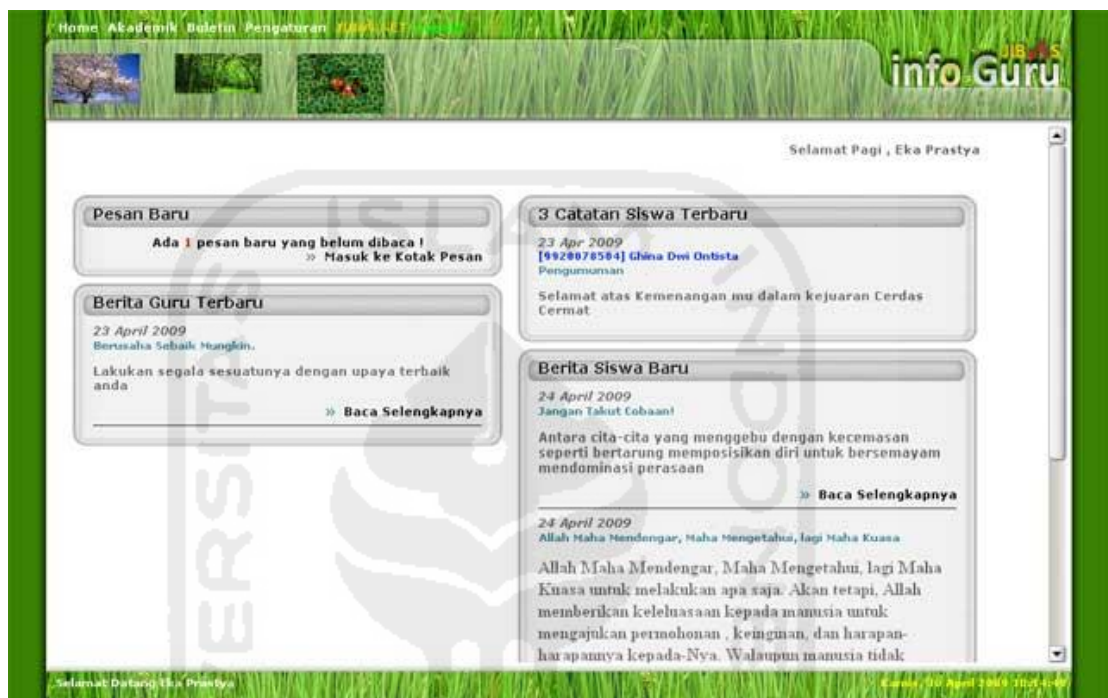
Gambar 2. 2 Halaman Info Guru Jibas

Pada gambar 2.2 terdapat halaman informasi guru dari sistem JIBAS. Pada halaman ini terdapat informasi mengenai adanya pesan baru yang belum terbaca, berita guru terbaru, catatan siswa terbaru serta berita siswa terbaru.