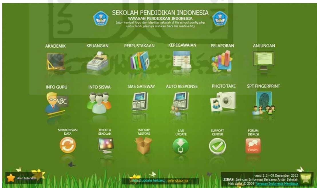
Gambar 2. 1 Halaman Antarmuka Jibas

Berikut adalah beberapa tampilan dari Jibas. Pada gambar 2.1, dapat dilihat halaman antarmuka JIBAS. Halaman ini didominasi warna background hijau, dengan icon icon yang cukup padat. Halaman antarmuka ini berisikan icon akademik, keuangan, perpustakaan, kepegawaian, pelaporan, anjungan, info guru, info siswa, sms gateway, auto response, photo take, SPT fingerprint, sinkronisasi data, jendela sekolah, backup restore, live update, support center, dan forum diskusi.