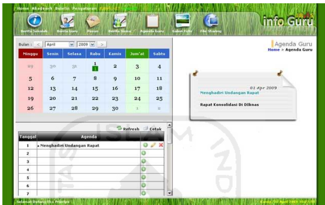
Gambar 2. 4 Halaman Agenda Guru Jibas