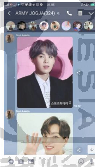
Gambar 2.7 Group Chat Line Army BTS Jogja (Diambil Dari Screnshoot Handphone, Tanggal 31/07/19)