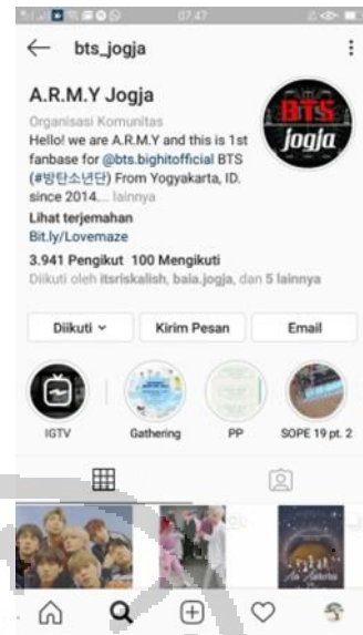
Gambar 2.5 Instagram BTS Jogja