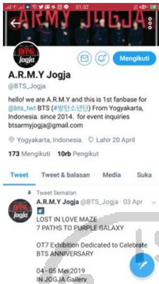
Gambar 2.4 twitter BTS Jogja (Diambil dari https://twitter.com/BTS_Jogja?s=08 , Tanggal 31/07/19)