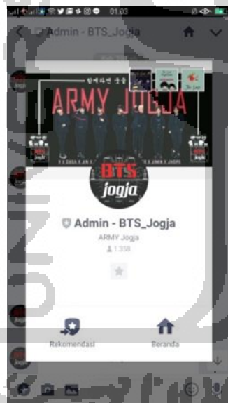
Gambar 2.6 Official Line Army BTS Jogja (Diambil dari Screnshoot Handphone, Tanggal 31/07/19)