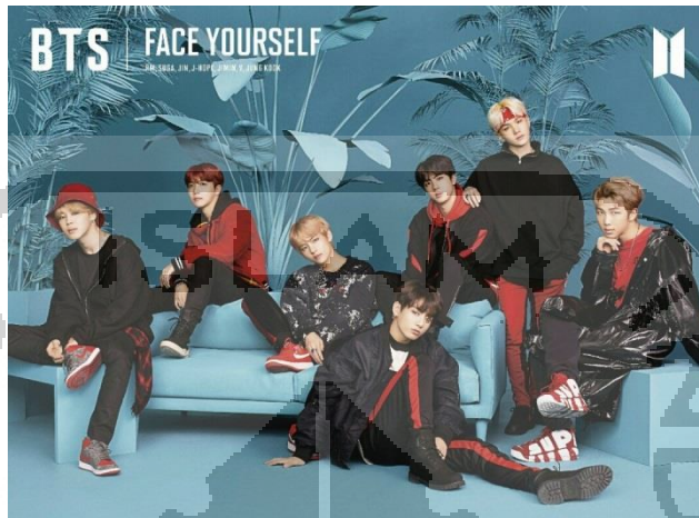
Gambar 2.1 BTS