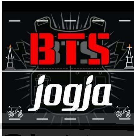
Gambar 2.3 Logo BTS Jogja

(Diambil dari https://images.app.goo.gl/kJbdBmFps15FJDhV7 , tanggal 31/07/19)