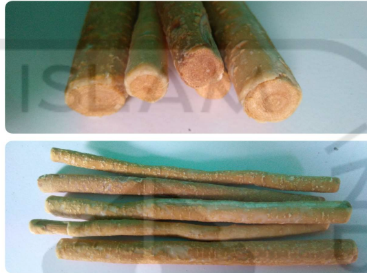
Gambar 2.2. Batang Siwak

sekitar 3,8 – 6,3 cm dan lebar 2 – 3,2 cm sedangkan diameter batang sekitar 1 – 2,5 cm. Penyebaran tanaman ini di Timur Tengah, Mesir, India, dan sekitarnya (Khatak et al, 2010).